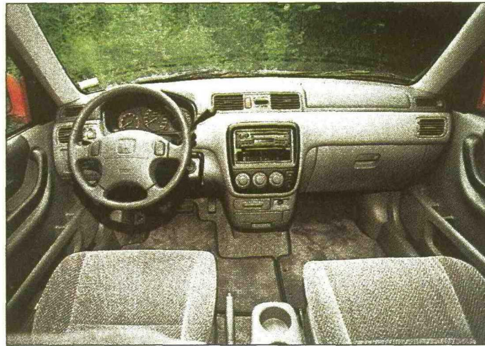
Im aufgeräumten und geräumigen Cockpit findet man sich auf Antrieb zurecht.

Das Temperament des CR-V mit Automatik ist natürlich etwas zurückhaltender (12,6 s und 162 km/h), doch weiss dieses «Powerteam» im Alltagsbetrieb mit angenehmen Manieren zu überzeugen. Die bei Honda «Grade Logic» getaufte «intelligente» Steuerung des automatischen Getriebes bestimmt anhand von sechs gespeicherten Programmen die idealen Schaltpunkte, je nach Fahrweise. Sie erkennt an der Gaspedalposition und der Bremsbetätigung eine enge Kurve oder Bergabfahrt und reagiert mit Herunterschalten. Bei soviel High-Tech ist nicht weiter erstaunlich, dass der «automatische» CR-V sogar noch ein Quentchen sparsamer unterwegs ist als der 5-Gänger. Der Durchschnittsverbrauch von 10,7 L/100 km (gegenüber 10,8) ist für diese Wagenklasse angemessen. Beide Varianten lassen sich auch mit weniger als