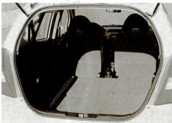
Mit komplett abgeklapptem Fondsitz entsteht enorm viel Stauraum.