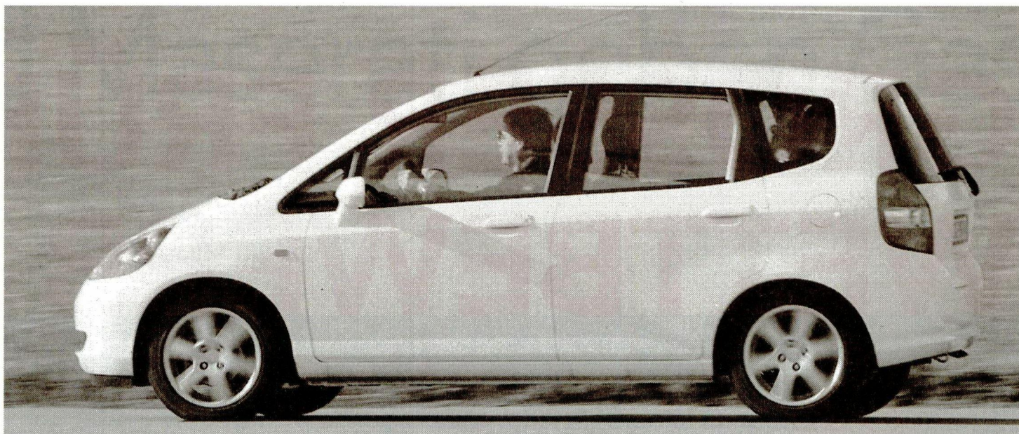
Der kurze Bug, die leicht keilförmige Linienführung und die grosszügig dimensionierten vierteiligen Seitenfenster verleihen dem Jazz Pfiff.

Beim Fahrwerk entschied sich Honda für Federbeine und Kurvenstabilisator vorne und für eine Verbundlenker-Hinterachse. Die Abstimmung von Federung und Dämpfung ist ein ausgewogener Kompromiss zwischen komfortbetont und straff, und die Aufbau-Seitenneigung hält sich in engen Grenzen. Der Jazz wartet mit einem gutmütigen Fahrverhalten auf. In Kurven schiebt der Frontriebler deutlich über die Vorderräder. Durch Gaswegnahme lenkt der Vorderwagen willig wieder auf den anvisierten Kurs ein, und dieser Lastwechsel wickelt sich ohne Tücken ab. Die elektrische Servolenkung ist mit dreieinhalb Umdrehungen von Anschlag zu Anschlag ausreichend direkt ausgelegt und führt Fahrerbefehle zielgenau aus. Der Geradeauslauf ist auch bei höherem Tempo einwandfrei. Aus belüfteten Scheiben vorne und Trommeln hinten setzt sich die Bremsanlage zusammen. Ergänzend hinzu kommen die elektro-