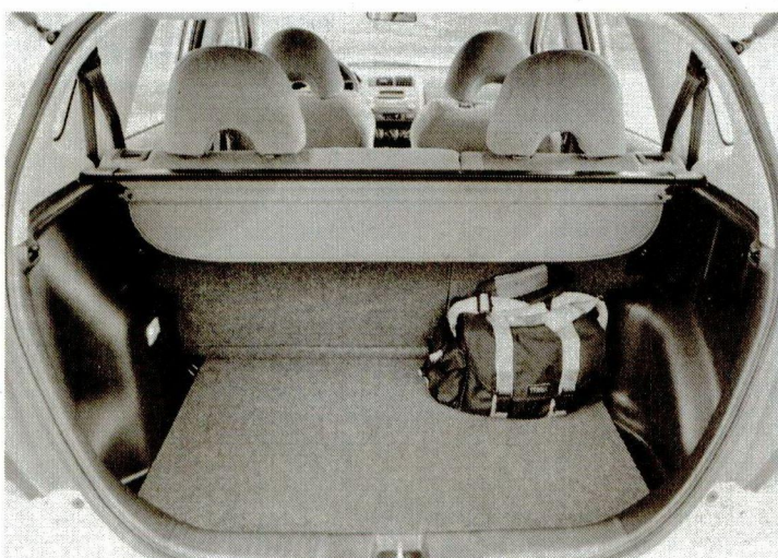
Selbst bei normaler Bestuhlung beträgt das Ladevolumen 380 dm 3 .

Der Jazz ist ein gelungener Wurf mit frechem Design und einem Raumkonzept, das ebenso überzeugt wie sein drehfreudiges und verbrauchsgünstiges Zweiventil-Triebwerk.